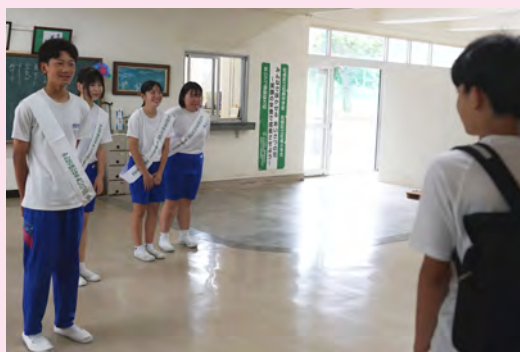
全学年混合の小集団による挨拶運動

の良い挨拶が増えたように感じます。挨拶について考えることで、生徒会執行部活動方針の一つである「友情」を、学年という横のつながりだけでなく、学年をまたいだ縦の繋がりにしていくという意図も感じられました。「自分たちの学年から挨拶の伝統を創ろう」という声が上がった学年や、独自の企画として、誰にでも気持ち良く挨拶することを促すポスターを作成した学年もありました。何気なく行っている挨拶を見直す良い機会になったように感じます。 様々な生徒の変化が見られ、挨拶すること自体が目標ではなく、挨拶について考えることに意味があるということを感じました。今後さらに挨拶の輪が広がり、それに伴って生徒一人ひとりの成長やより活気溢れる松崎中学校へと発展していくことを期待しています。