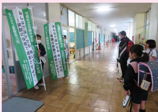
大きな声で元気にあいさつしよう

また、企画委員会の児童が創意工夫を凝らし、「相手に聞こえる声であいさつをする」「大きな声ではっきりとあいさつをする」といったポイントを記したポスターを掲示し、子供たちへの意識付けを行っています。 さらに、全校児童の生活目標として「大きな声で元気にあいさつしよう」を設定し、登下校時や学校内外のさまざまな場面でも相手に気持ちが伝わるあいさつを心掛ける指導も実施しています。特に、バスの中や通学路など、日常のさまざまな場面でのあいさつの大切さを伝え、子供たちの社会性やマナーの向上を促しています。 この取組は、子供たちの人間関係を豊かにし、地域社会とのつながりを深めることにも寄与しています。松崎小学校では、今後も継続的にあいさつ運動を推進し、子供たち一人一人の心豊かな成長を支援していきます。