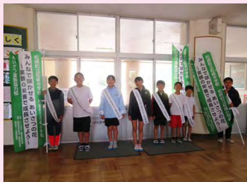
毎朝企画委員が昇降口であいさつ運動

松崎町立松崎小学校では、地域の教育活動の一環として、「明るくあいさつ」の実践運動に力を入れています。この取組は、21世紀松崎町の三つの実践運動のひとつとして位置づけられ、子供たちの豊かな人間性を形成するためのコミュニケーション能力の育成を目的としています。 年間を通して、企画委員会（高学年）が中心となって、毎朝のあいさつ運動に取り組み、学校全体の雰囲気明るくすることを目指しています。活動のテーマを「みんなで咲かせるあいさつの花」笑顔の栄養で成長させよう」とし、昇降口付近で元気よくあいさつを交わすことを通じて、子供たち同士の心の交流が深まり、礼儀正しさや思いやりの心が育まれてきています。