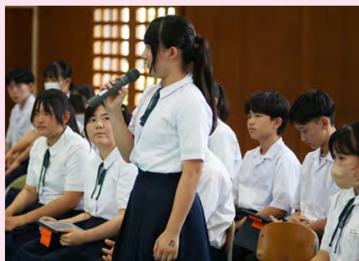
生徒総会で挨拶について意見を交わしました

また、企画委員会の児童が創意工夫を凝らし、「相手に聞こえる声であいさつをする」「大きな声ではっきりとあいさつをする」といったポイントを記したポスターを掲示し、子供たちへの意識付けを行っています。 さらに、全校児童の生活目標として「大きな声で元気にあいさつしよう」を設定し、登下校時や学校内外のさまざまな場面でも相手に気持ちが伝わるあいさつを心掛ける指導も実施しています。特に、バスの中や通学路など、日常のさまざまな場面でのあいさつの大切さを伝え、子供たちの社会性やマナーの向上を促しています。 この取組は、子供たちの人間関係を豊かにし、地域社会とのつながりを深めることにも寄与しています。松崎小学校では、今後も継続的にあいさつ運動を推進し、子供たち一人一人の心豊かな成長を支援していきます。